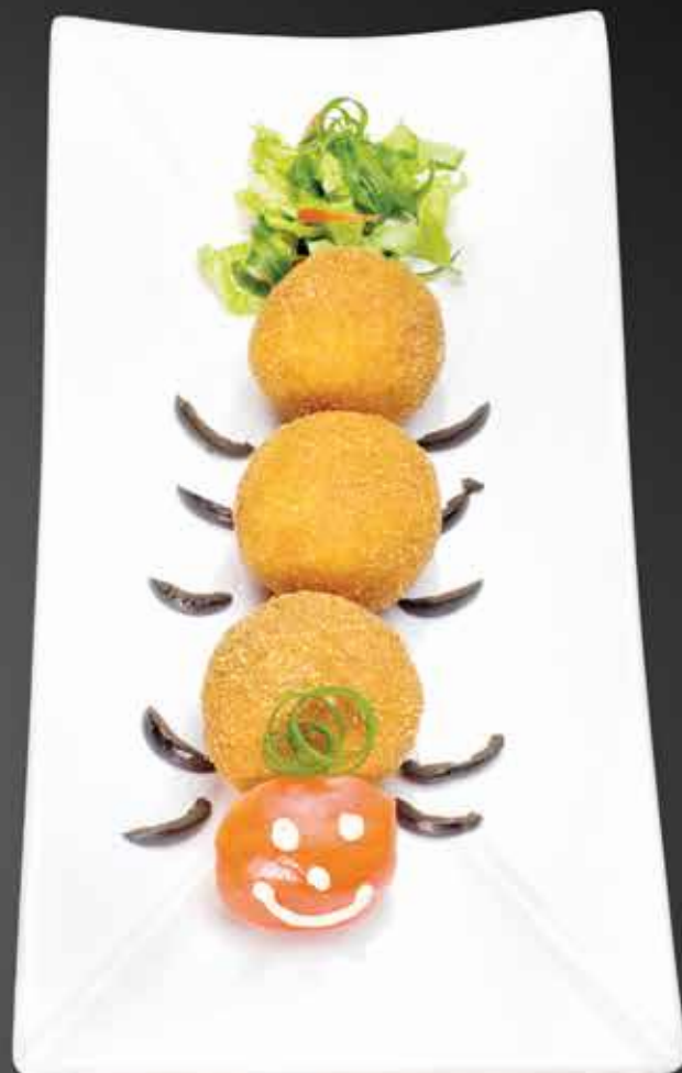
115 ₺ ВЕСЕЛАЯ СОРОКОНОЖКА хрустящие картофельные шарики с сыром 150 гр.