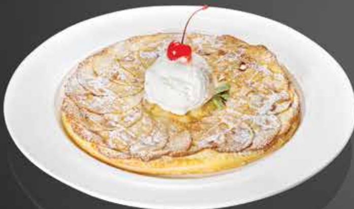
235 ₺ ЭЛЬЗАССКИЙ ЯБЛОЧНЫЙ ПИРОГ из слоеного теста с карамельным соусом, корицей и шариком мороженого 300 гр.