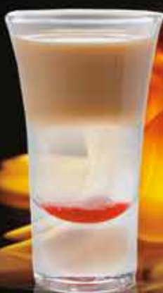
СЛЕЗЫ АНГЕЛА 40 мл 225 ₺