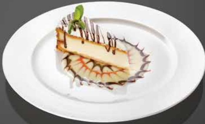
195 ₺ ЧИЗКЕЙК КЛАССИЧЕСКИЙ сырный торт с тремя соусами 190 гр.