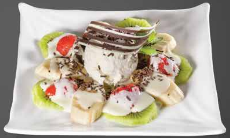
175 ₺ КАРПАЧЧО ИЗ ФРУКТОВ легкий десерт из бананов, киви и клубники. Подается с шариком домашнего мороженого 200 гр.