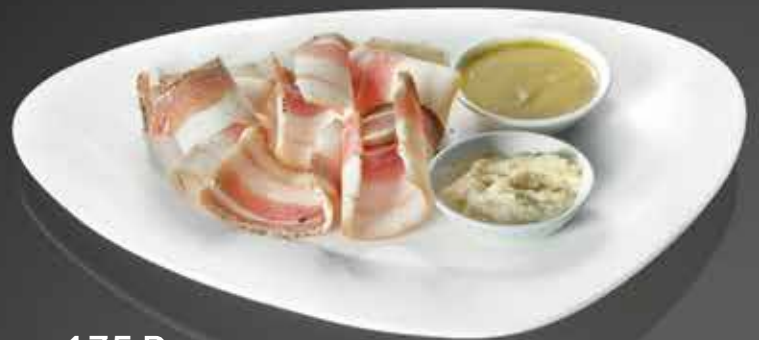
135 Р САЛЬЦЕ С МОРОЗЦА с ядерной горчицей и хреном 75/20/20 гр.