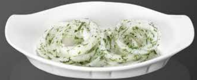
30 ₺ ЛУК МАРИНОВАННЫЙ-БЕЛЫЙ 50 гр. 50 ₺ КРАСНЫЙ 50 гр.