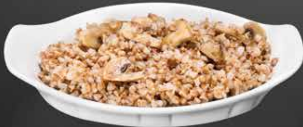
90 ₺ КАША ГРЕЧНЕВАЯ С ГРИБАМИ 150 гр.