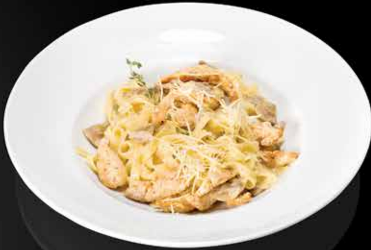
355 ₺ ТАЛЪЯТЕЛЛЕ С ГРУДКОЙ ЦЫПЛЕНКА, ШАМПИНЬОНАМИ И СЫРОМ ГРАНО 330 гр.