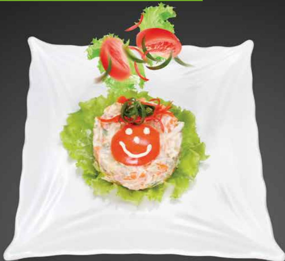
125 ₺ ОЛИВЬЕШКА 150 гр.