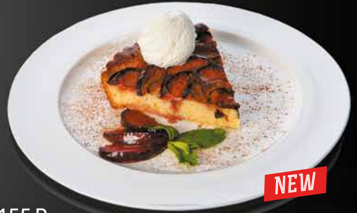
155 ₺ ТЕПЛЫЙ СЛИВОВЫЙ ПИРОГ С МЯГКИМ МОРОЖЕНЫМ 200 гр.