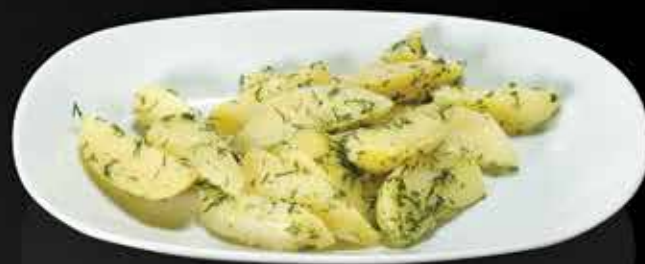
55 ₺ КАРТОФЕЛЬ РАЗВАРНОЙ с маслом и укропом 150 гр.