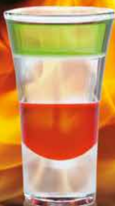
ИТАЛЬЯНСКИЙ ФЛАГ 40 мл 200 ₺