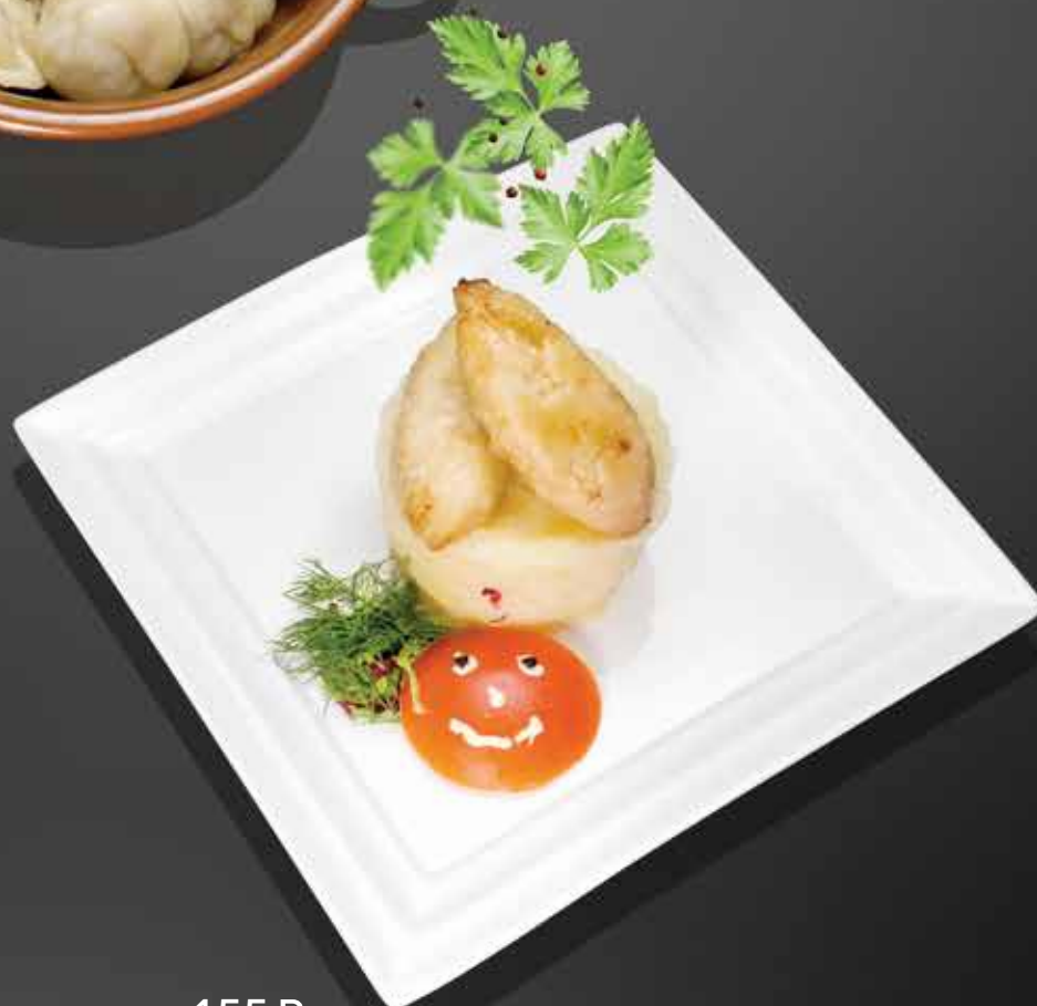
155 Р КОТЛЕТКИ ИЗ СУДАКА И ЛОСОСЯ с картофельным пюре 190 гр.