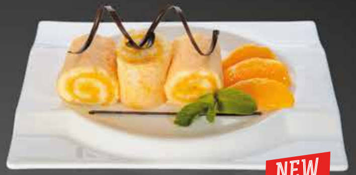
195 ₺ НЕЖНЫЙ РУЛЕТ С ШОКОЛАДОМ И ЦИТРУСОВЫМ КРЕМОМ 190 гр.