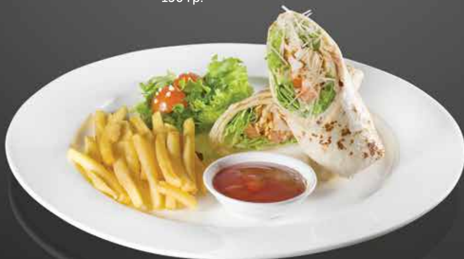
215 ₺ ЦЕЗАРЬ В ТОРТИЛЬЕ салат с цыпленком-гриль в пшеничной лепешке 300 гр. гр.