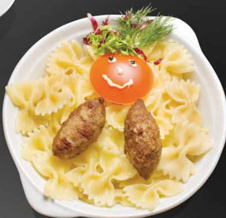
155 ₺ КОТЛЕТКИ ИЗ ТЕЛЯТИНЫ с макаронками 190 гр.