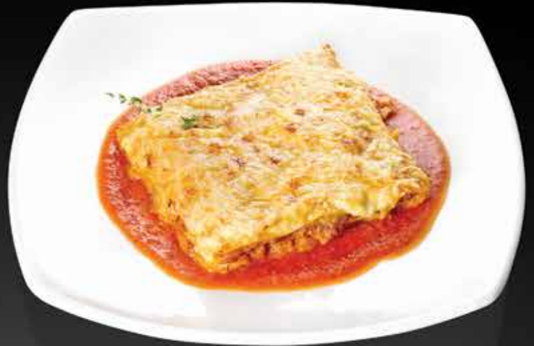
335 ₺ ЛАЗАНЬЯ БОЛОНЬЕЗ С РУБЛЕННОЙ ТЕЛЯТИНОЙ томленной в красном вине с прованскими травами 300 гр.