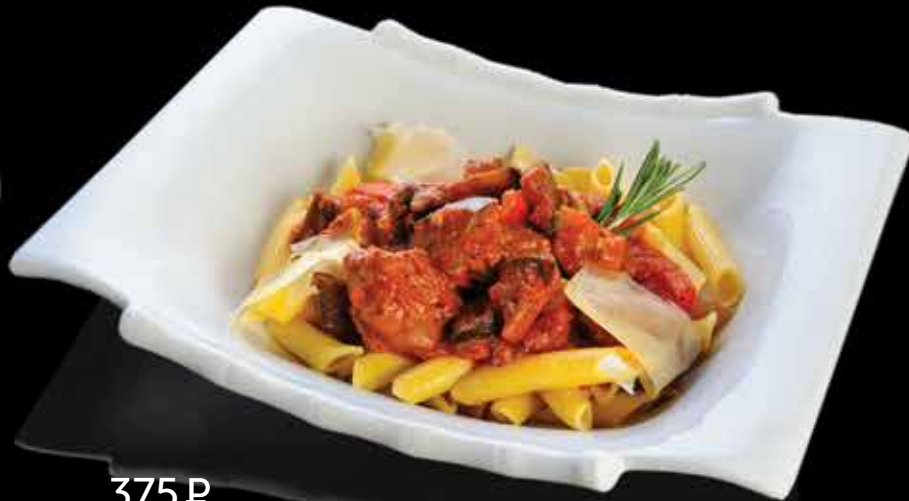
375 ₺ ПЕННЕ С РАЗВАРНОЙ БАРАНИНОЙ с острым соусом, болгарским перцем, цукини и баклажанами 330 гр.