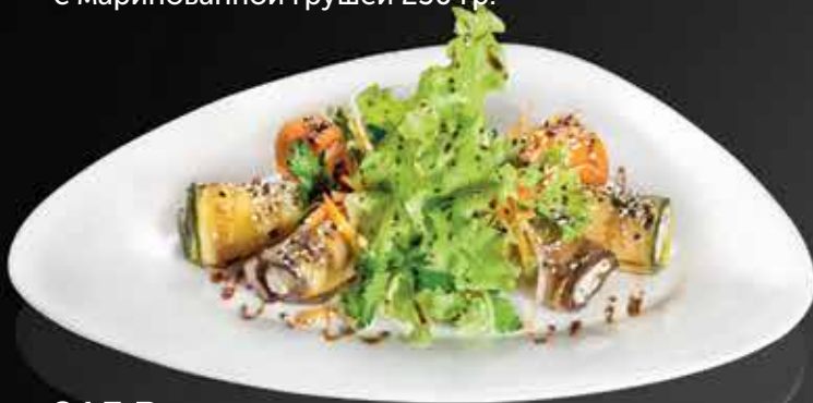
215 Р МИКС ИЗ ОВОЩНЫХ РУЛЕТКОВ с творожным сыром, жгучим перцем и зеленью 175 гр.