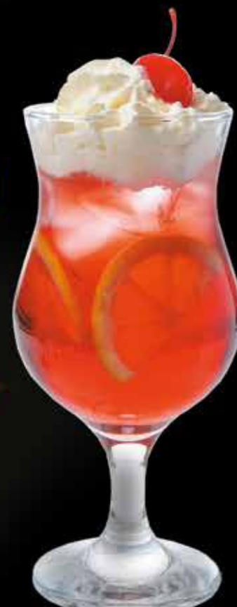
ЗИМНЯЯ ВИШНЯ 250 мл 355 ₺