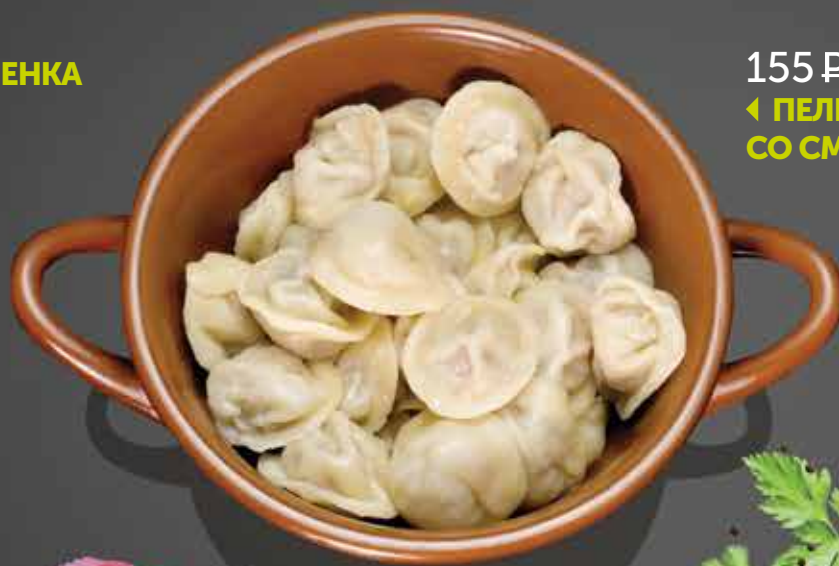
155 Р ПЕЛЬМЕШКИ СО СМЕТАНКОЙ 180 гр.