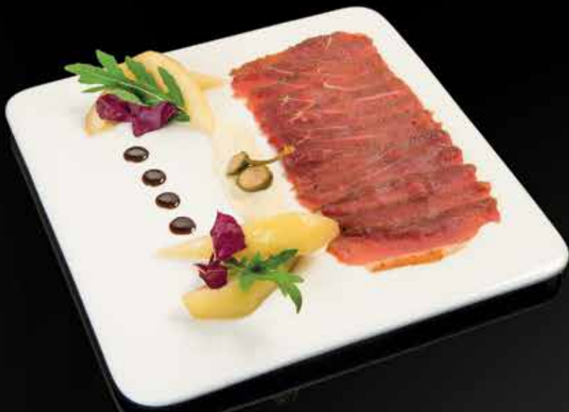
415 Р КАРПАЧО ИЗ ПОДКОПЧЕННОЙ УТИНОЙ ГРУДКИ с маринованной грушей 230 гр.