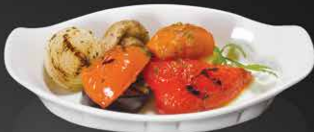
165 ₺ ОВОЩИ-ГРИЛЬ баклажаны, томаты, перец болгарский, шампиньоны, картофель, лук репчатый 180 гр.