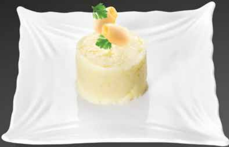
60 ₺ КАРТОФЕЛЬНОЕ ПЮРЕ 150 гр.