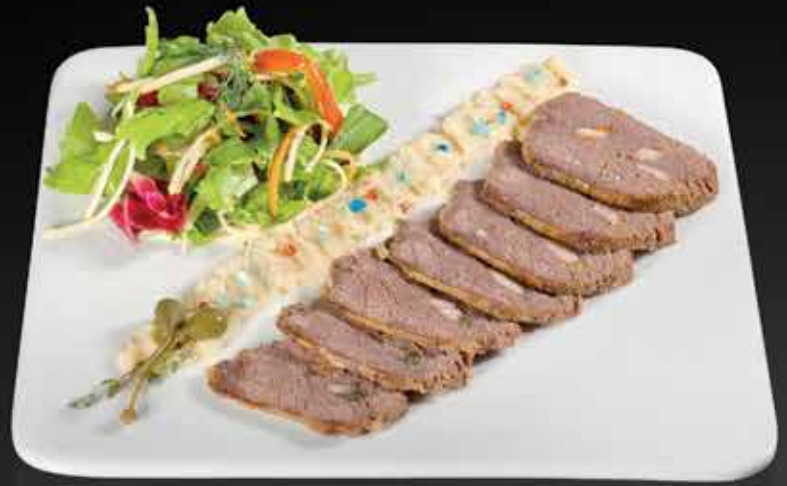
275 Р ЛОСЯТИНА ШПИГОВАННАЯ с яблочным хреном 170 гр.