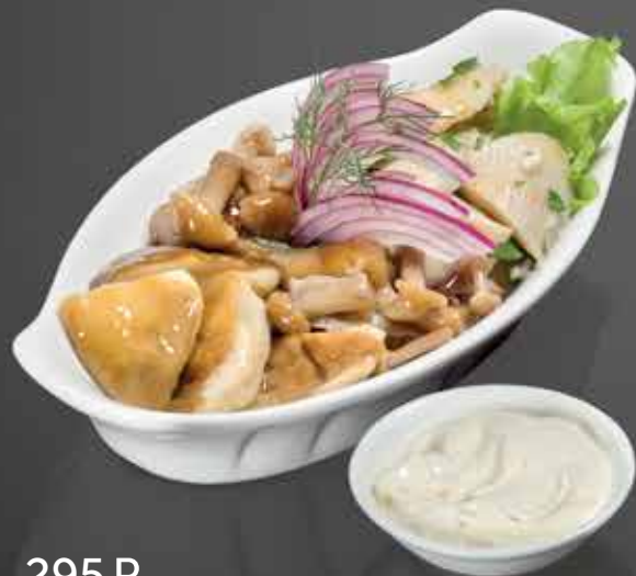
295 Р ЗАКУСКА ДИСПЕТЧЕРА №1 грузди бочковые, гриб белый и опята маринованные, с луком и сметаной 200 гр.