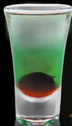
BERRYMINT 40 мл 200 ₺