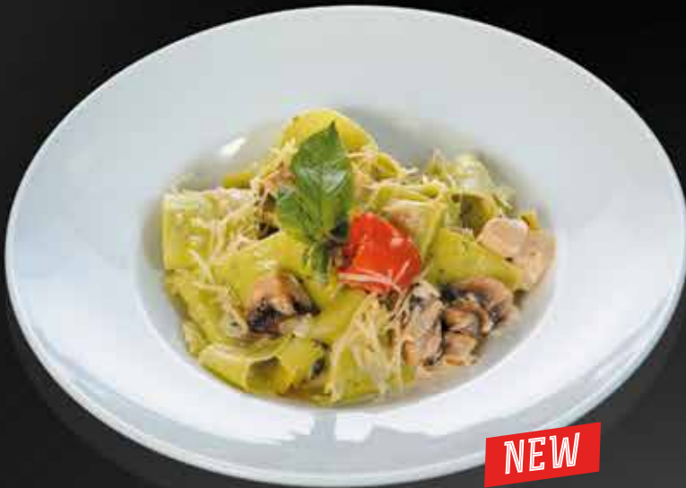
275 ₺ ПАСТА РУЧНОЙ РАБОТЫ С РУКОЛОЙ с грибами, сливочным сыром и вялеными томатами 280 гр.