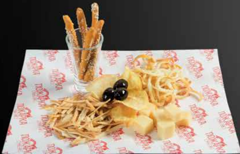
225 Р ЛЮБИМЫЕ СЫРЫ ПОЖАРНОГО сыры к пиву (с маслинами) 150 гр.