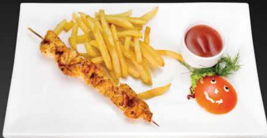
155 Р ШАШЛЫЧОК ИЗ ЦЫПЛЕНКА 180 гр.