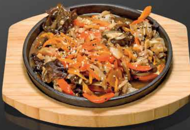
255 Р УШКИ СВИНЫЕ с древесным грибом, в соево-устричном соусе 300 гр.