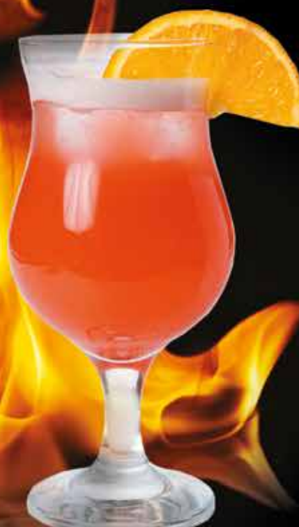
СЕКС НА ПЛЯЖЕ 260 мл 220 ₺