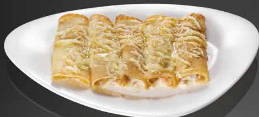
175 ₺ БЛИНЧИКИ С ВЕТЧИНОЙ И СЫРОМ 230 гр.