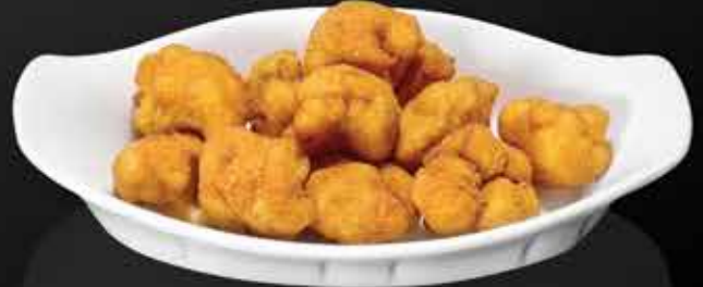
100 ₺ КАПУСТА ЦВЕТНАЯ В ХРУСТЯЩИХ СУХАРИКАХ 180 гр.