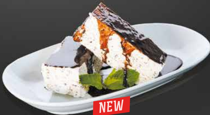
170 ₺ МЯТНЫЙ СЕМИФРЕДО десерт-мороженое 125 гр.