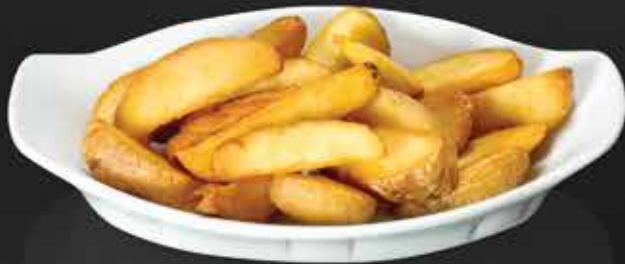
100 ₺ КАРТОФЕЛЬ ПО-ДЕРЕВЕНСКИ 150 гр.