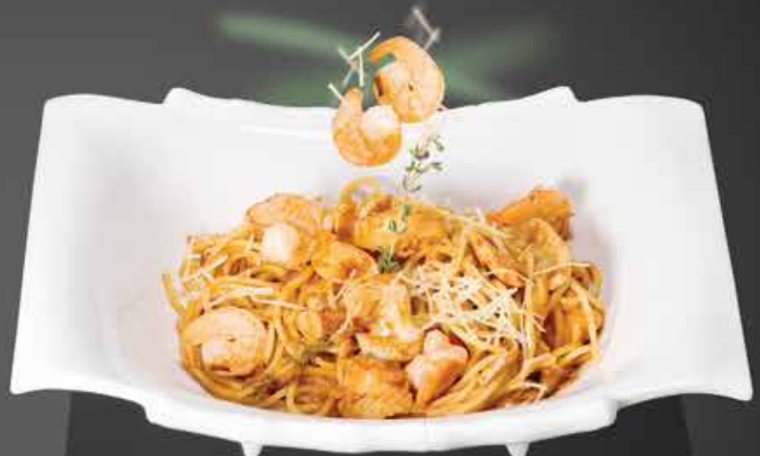
435 ₺ СПАГЕТТИ С МОРЕПРОДУКТАМИ 320 гр.