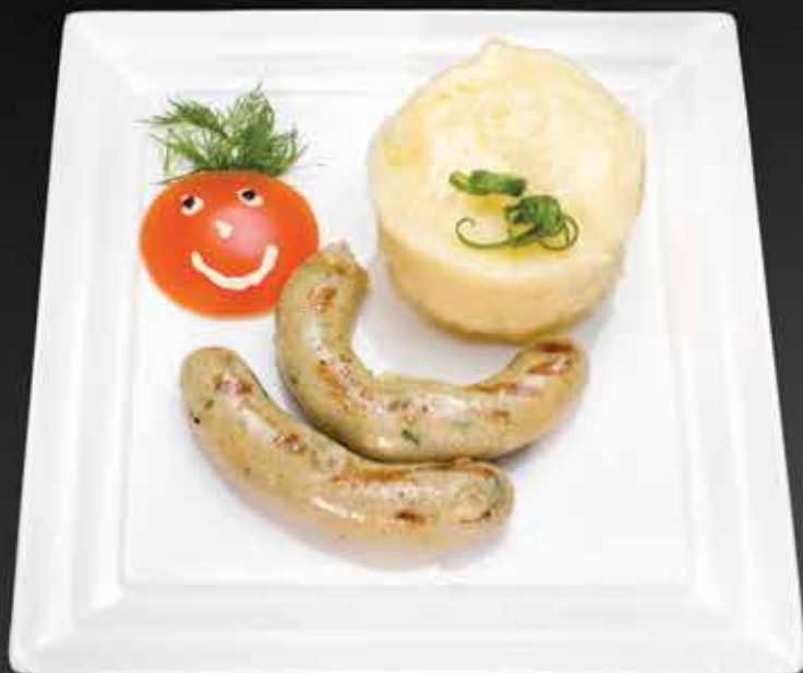
195 Р КОЛБАСКИ ИЗ ЦЫПЛЕНКА 190 гр.