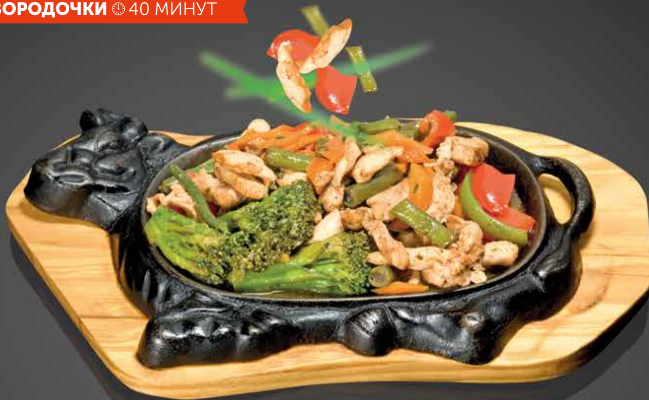
275 Р ГРУДКА ЦЫПЛЕНКА С ОВОЩАМИ под соевым соусом 300 гр.