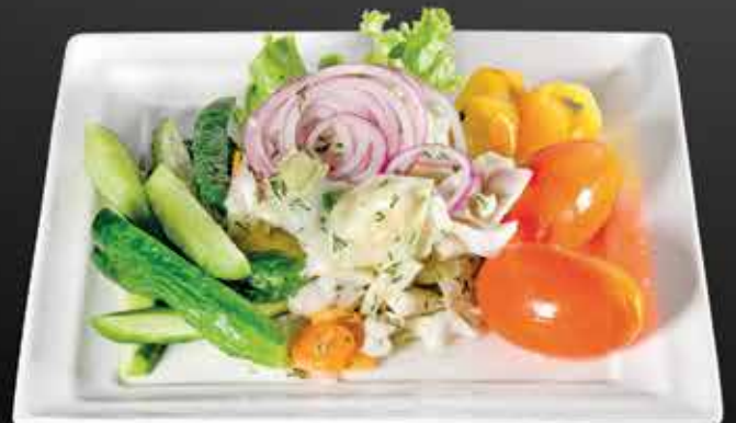
205 Р ПЕРВИЧНОЕ СРЕДСТВО ПОЖАРОТУШЕНИЯ соленья из домашнего погребка, приготовленные специально для Вас 450 гр.