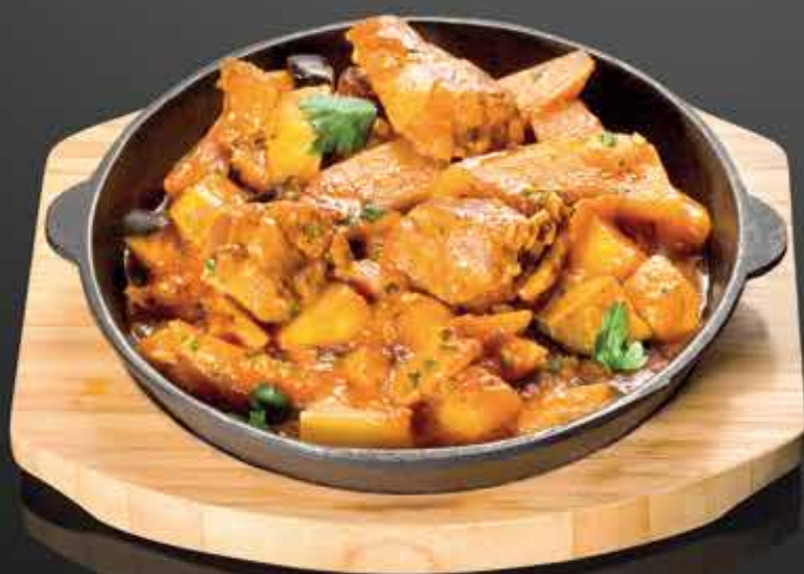
375 Р ФИЛЕ БАРАШКА с баклажанами, цукини, сладким перцем и дольками картофеля 300 гр.