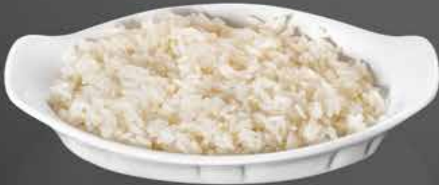
55 ₺ РИС 150 гр.