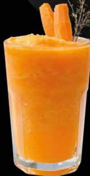
СМУЗИ МОРКОВЬ- АПЕЛЬСИН