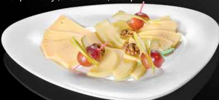
315 Р ЛЮБИМЫЕ СЫРЫ ПОЖАРНОГО сыры к вину (с грецким орехом, виноградом и грушей) 170 гр.