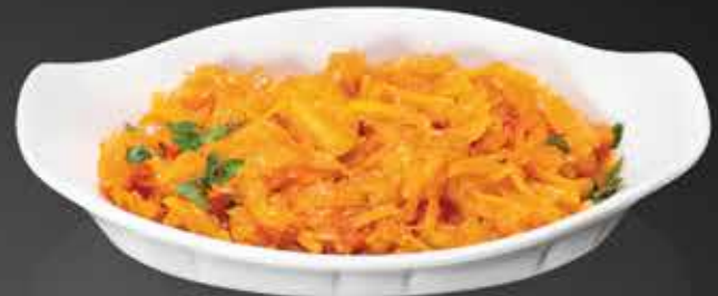
80 ₺ КАПУСТА ПО-МЮНХЕНСКИ тушеная с яблоками 150 гр.