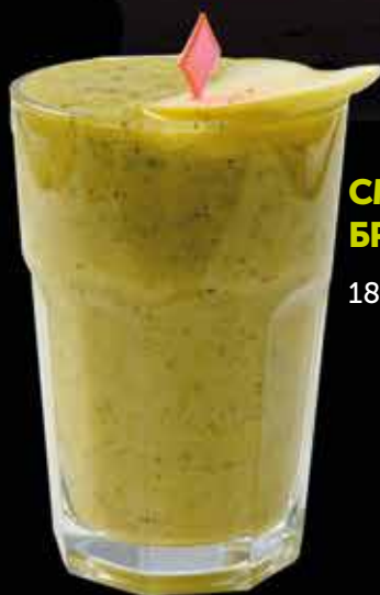
СМУЗИ КИВИ- БРОККОЛИ