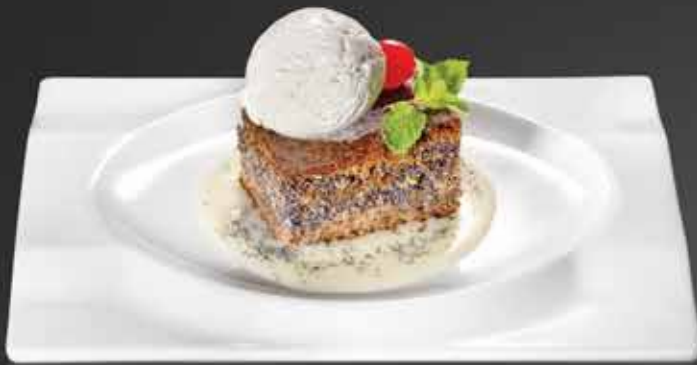
195 ₺ МАКОВЫЙ горячий кекс с ванильным соусом и шариком домашнего мороженого 250 гр.