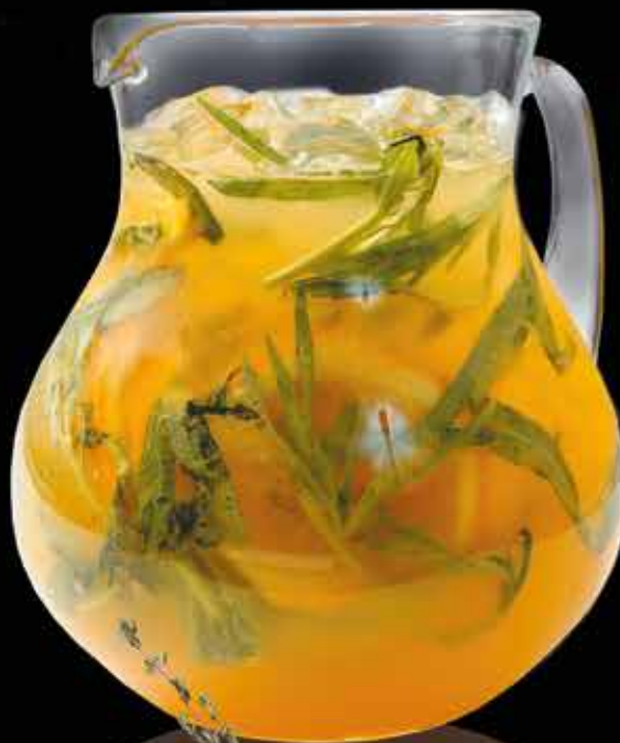
ОРАНЖ И ТАРХУН