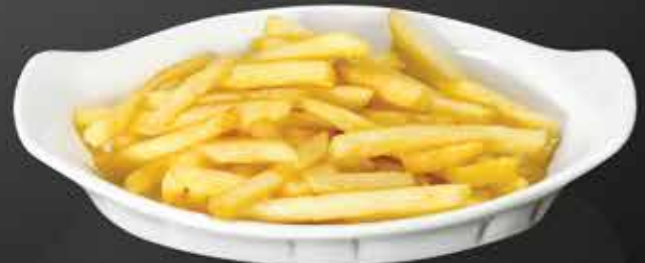
90 ₺ КАРТОФЕЛЬ ФРИ 100 гр.