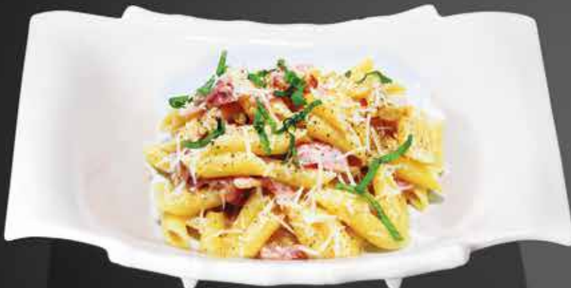
275 ₺ ПЕННЕ КАРБОНАРА с беконом и сыром грано 300 гр.