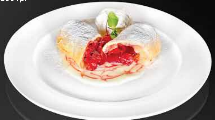
195 ₺ ШТРУДЕЛЬ С ВИШНЕЙ с ванильным соусом 285 гр.