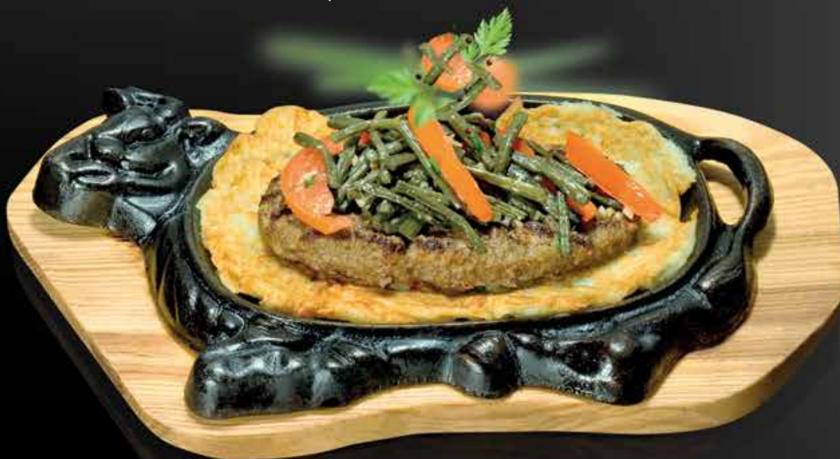
315 Р БИФШТЕКС РУБЛЕННЫЙ ИЗ МЯСА МАРЛА на картофельном дранике, с салатом из папоротника 380 гр.