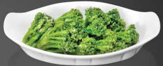
90 ₺ КАПУСТА БРОККОЛИ 150 гр.