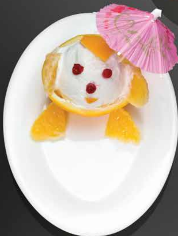
75 Р СИНЬОР АПЕЛЬСИН домашнее ванильное мороженое в апельсиновой корзинке, с дольками апельсина и клюквой 100 гр.